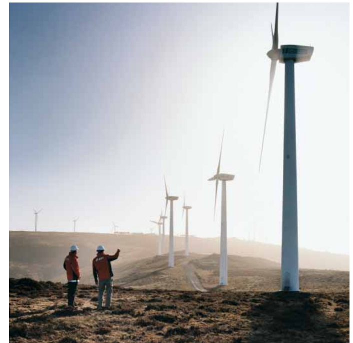
Pico Gallo in Spanien ist eine unserer fast 60 Onshore-Anlagen, die zusammen weltweit mehrere 100.000 Haushalte versorgen.

Wir bieten viel. Vor allem spannende Aufgaben. Wer bei uns seine Karriere startet oder fortsetzt, kann sich auf vielfältige, internationale und herausfordernde Aufgaben freuen. Wir haben einen klaren Kurs und streben mit unserem breit aufgestellten Strom- und Gasgeschäft langfristig eine Spitzenposition im internationalen Wettbewerb an. Der Ausbau unserer führenden Positionen in unseren europäischen Kernmärkten wie Deutschland und Großbritannien zählt ebenso dazu wie gezieltes Wachstum in neuen Märkten wie Spanien, Italien oder Russland. Auch Nordamerika gehört als Wachstumsregion für unser Engagement in Erneuerbaren Energien dazu. Im Zentrum unseres Handelns steht dabei stets die sichere, bezahlbare und nachhaltige Versorgung unserer Kunden mit Strom und Gas.