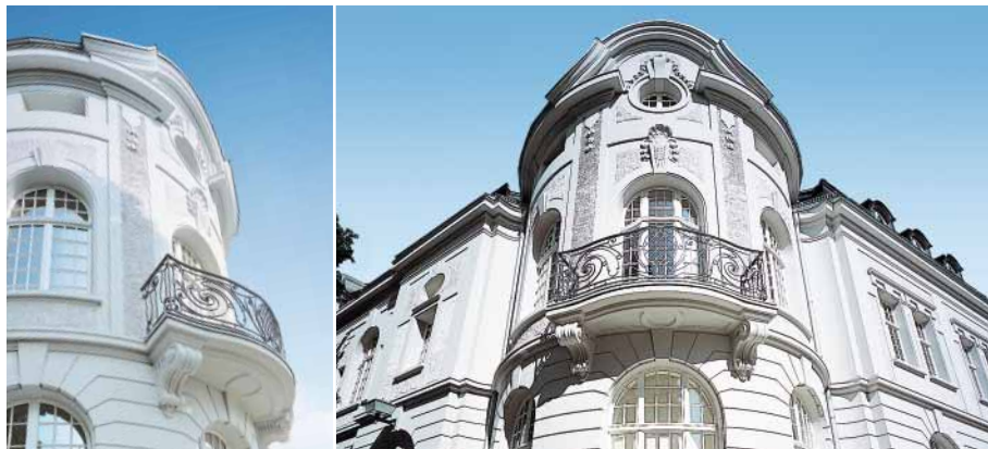
Die E.ON Academy, ein wichtiger Baustein unserer systematischen Führungskräfte-Entwicklung und internen Bildungsarbeit.

Die Seminare werden mit ausgewählten E-Learning-Modulen ergänzt, die auf der konzernweiten Lernplattform Academy Online kostenlos für alle Mitarbeiter bereitstehen. Und Academy Online bietet noch weit mehr: schnelles Nachschlagen von Fachbegriffen, zeitintensives Selbststudium oder Diskussionsrunden mit Mitarbeitern aus anderen Geschäftseinheiten. In der Online-Bibliothek sind mehr als 6.000 Werke zu finden. Die E.ON Academy setzt damit als internes Bildungsinstitut Maßstäbe.